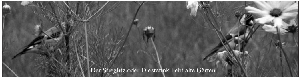
Der Stieglitz oder Diestefink liebt alte Gärten.

Unter dem Titel „Gesegnete Vielfalt – Kirchen in Europa aktiv für den Artenschutz“ hat der Umweltbeauftragte der Evangelischen Kirchen in Württemberg eine praktische Handreichung (24 Seiten) herausgegeben. Sie ist ein kirchlicher Beitrag zum Jahr der biologischen Artenvielfalt 2010.