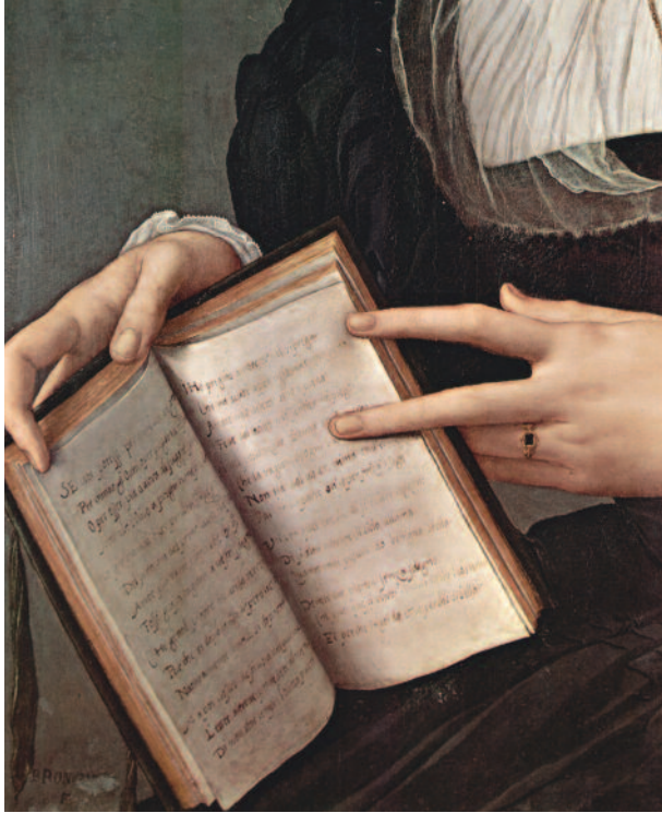
Angelo Bronzino: Porträt der Laura Battiferri, Detail (1550-55)