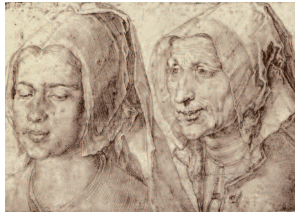
Albrecht Dürer: Frauenköpfe (1520)

Zwölf dieser Frauen werden innerhalb einer Wanderausstellung stellvertretend für alle anderen einen besonderen Platz bekommen. „Patinnen“ aus der Gegenwart stellen sie den Ausstellungsbesuchern vor und schlagen so die Brücke in unsere heutige Zeit.