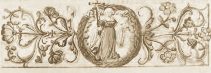
Jobannes von Bugenbagen: Deutscher Psalmenkommentar (1543), Detail