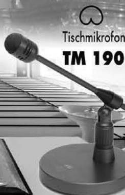
○ Tischmikrofon TM 190

seit 1928 Kondensatormikrofone für Studio- und Messtechnik