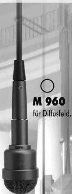
○ M 960 für Diffusfeld,