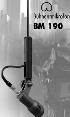
○ Bühnenmikrofon BM 190