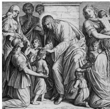
Aus: J. Schnorr von Carolsfeld: "Die Bibel in Bildern", Copyright 1990 by Hänssler Verlag, D-71087 Holzgerlingen – „Jesus segnet die Kinder“

„Lasst die Kinder zu mir kommen und wehret ihnen nicht; denn solchen gehört das Reich Gottes.“ Markus 10,14