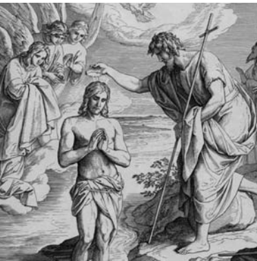
aus: J. Schnorr von Carolsfeld: "Die Bibel in Bildern", © Copyright 1990 by Hänssler Verlag, D-71087 Holzgerlingen – „Taufe Jesu“

Als Zeichen der Abkehr von einem gottesfernen Leben taufte Johannes die Täuflinge im Fluss Jordan. Das Untertauchen und anschließende Wiederauftauchen symbolisierte die Wende im Dasein und den Anfang eines neuen, befreiten Lebens, umschlossen und beschützt von Gottes Liebe. Diese Bedeutung spiegelt sich bis heute im Gebrauch des Taufwassers wider.