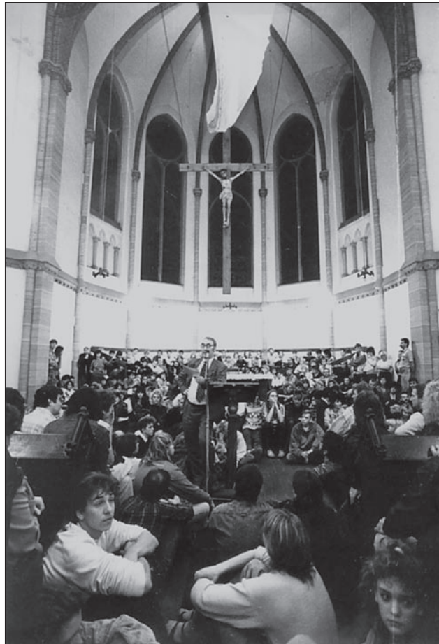
Wie hier in Gera versammelten sich im Herbst 1989 DDR-weit Menschen in den Kirchen

Jeder Ort, an dem es Friedensgebete, Demonstrationen, Streiks, Machtübernahmen und andere Ereignisse der Revolution gegeben hat, kann hier verzeichnet werden. In einer Begleitbroschüre sollen vor