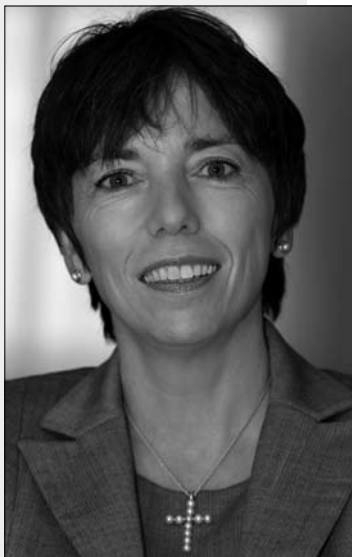
Die hannoversche Landesbischöfin Margot Käßmann ist neue EKD-Ratsvorsitzende

In 12 Wahlgängen wurden 14 Ratsmitglieder bestimmt