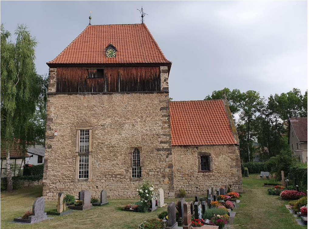
Kirche Sankt Nikolaus zu Hausen