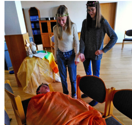
Maria und Martha trauern um Lazarus

Zur Konfirmandenfreizeit im Januar in Erfurt haben sie sich mit der Geschichte von Lazarus und seinen Schwestern Martha und Maria beschäftigt.