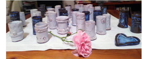
Links: in Erfurt in der Synagoge Oben: Töpfern beim Konficamp in Siloah