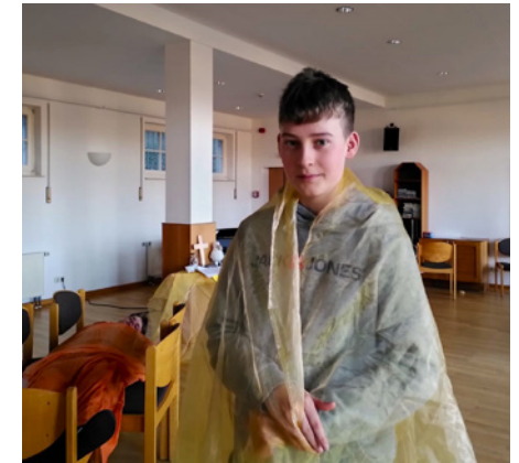
Hallo, ich bin Jesus