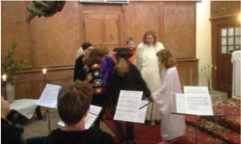
Ein Osterspiel in Ivenrode