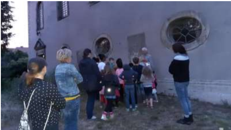
Taschenlampenführung in der Dämmerung in und um die Kirche

Herr Jesus, so komme doch bald, füll uns mit Wärme und Licht! In dieser Welt ist es so kalt, lass uns verzagen nicht!