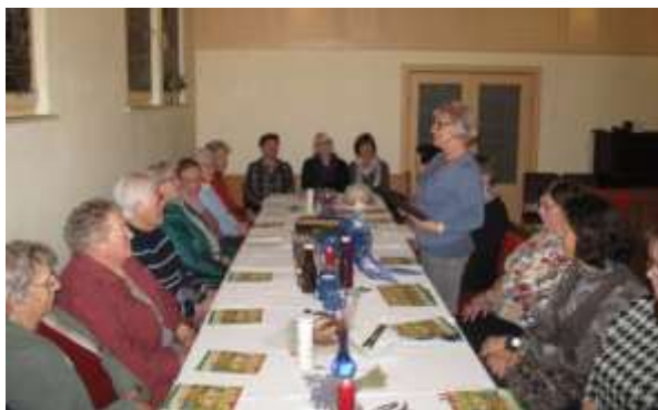
„Kommt, alles ist bereit“ so hieß es im Jahr 2019 zum WGT der Frauen

Die Lieder und Texte in jedem Jahr für einen besonderen Gottesdienst an diesem ersten Freitag im März stellen Frauen aller Konfessionen aus verschiedenen Län-