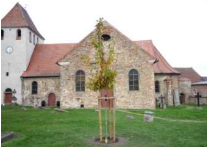
Bernhard Brügner-Eiche, erster evangelischer Pfarrer 1524 zum Reformationsjubiläum 2017 gepflanzt, eine Roteiche