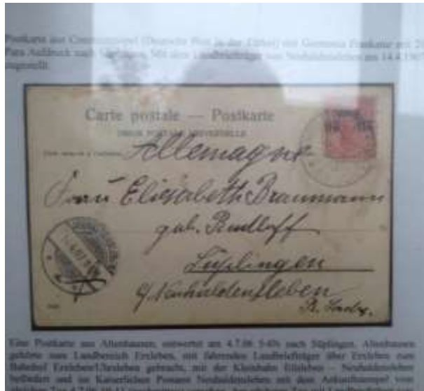
Postkarte aus Altenhausen nach Süplingen 4.7.1906.

Wir machten uns zu Fuß auf den Weg nach Süplingen. Auf der Kanalbrücke kam uns doch noch ein Taxi entgegen. Wir bildeten eine Kette, um das Fahrzeug aufzuhalten. Der Taxifahrer war auf dem Weg nach Hause. Er hatte eine sehr anstrengende Tour hinter sich und wollte niemand mehr mitnehmen. Doch als er mich in meinem Brautkleid sah, hatte er Erbarmen und fuhr mich und meine Lieben heim.