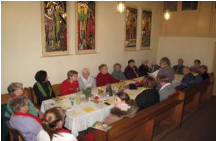
WGT der Frauen 2020: Wir sind tief beeindruckt vom Mut und Taten- drang der Frauen aus Simbabwe. Nach dem GD haben wir noch Köst- lichkeiten aus Afrika probieren können, auch "Hagelsturm über Afrika".